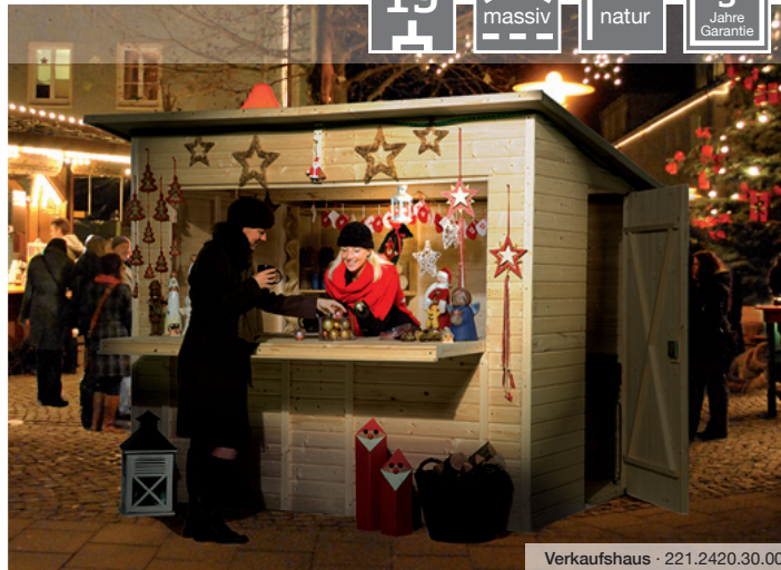
Verkaufshaus · 221.2420.30.00